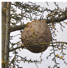
Nid d'une colonie

Oui. La destruction des colonies reste la méthode la plus efficace pour diminuer les populations de Frelon asiatique. Celle-ci doit se faire le plus tôt possible et jusqu'à mi-décembre. Le Frelon asiatique étant diurne, les nids doivent être détruits à la tombée de la nuit ou au lever du jour. Ainsi la quasi-totalité de la colonie peut être éliminée.