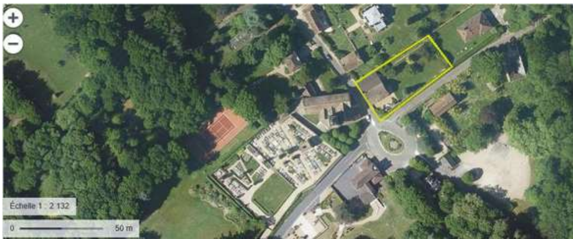
Vue satellite Géoportail de la propriété 2 rue de la Maison Forte et de son environnement proche

Une partie de la clôture du terrain entourant l'auberge sera retirée afin de lui redonner une ouverture et une visibilité à partir de la place comme cela était à l'origine