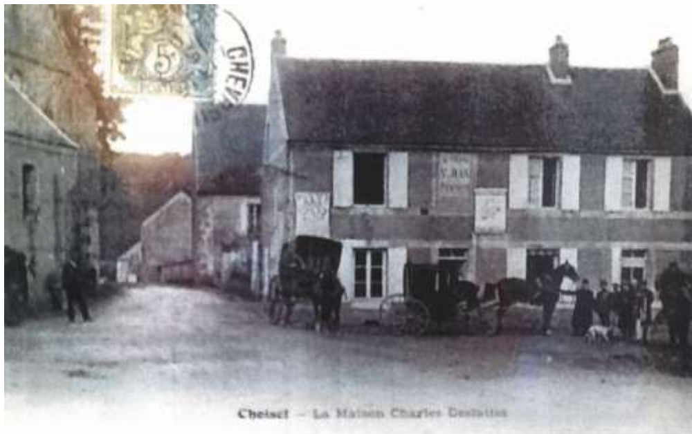
Ancienne Auberge 2 rue de la Maison forte (ancienne carte postale)

Le bâtiment se situe au cœur du bourg de Choisel au pied de l'église et à proximité de la mairie et de l'Espace Ingrid Bergman (ancienne mairie-école dédiée à la vie associative). Celui-ci a été une auberge jusqu'en 1965, date à laquelle il a été transformé en habitation.